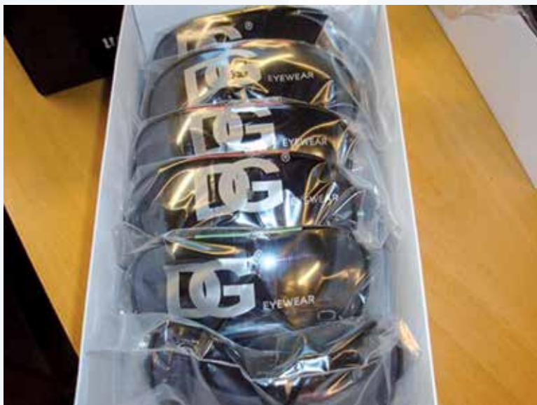
DG päikeseprillid. Foto: MTA

Pildid kaubast, mis MTA 2013. aastal avastas.