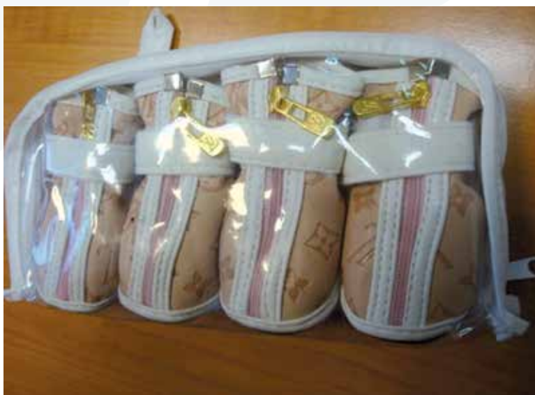
LV kotid.